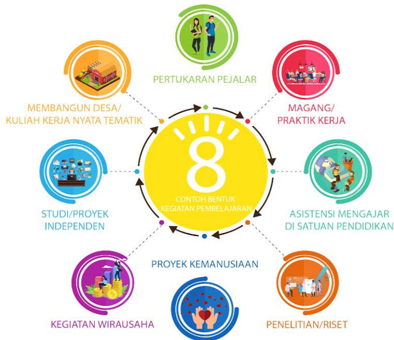
Gambar 1. Kegiatan pembelajaran sesuai Permendikbud No 3 Tahun 2020 Pasal 15 ayat 1

Selaras dengan pembelajaran Kampus Merdeka, kegiatan PKM diharapkan dapat memberikan kesempatan dan tantangan dalam pengembangan kreativitas, inovasi, dan kapasitas, serta kemandirian dalam mencari dan menemukan pengetahuan atau solusi melalui masalah dan dinamika yang ada di masyarakat. Penjelasan rekomendasi konversi sks dapat dilihat di Buku Pedoman Umum PKM. Menurut Permendikbud No 3 Tahun 2020 Pasal 15 ayat 1. Bentuk kegiatan pembelajaran yang sesuai dengan PKM-RE adalah Riset, dan Studi/Proyek Independen seperti terlihat dalam Gambar 1.