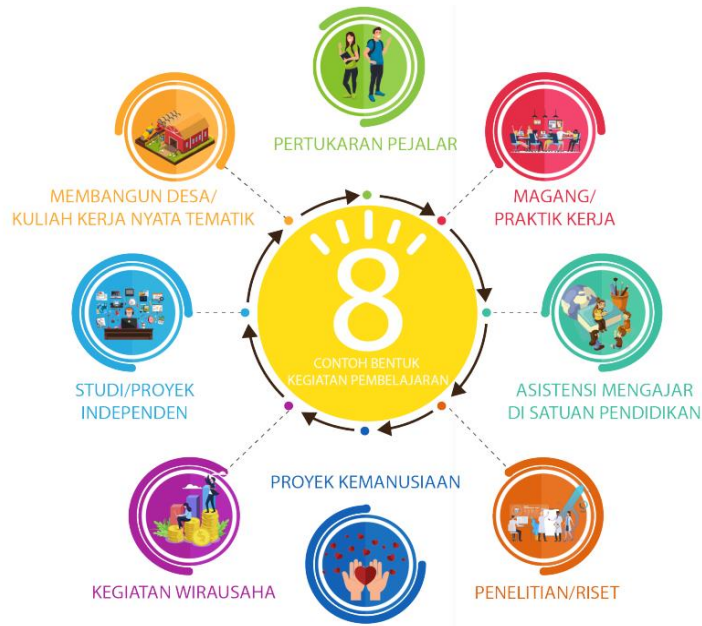
Gambar 2. Kegiatan pembelajaran sesuai Permendikbud No 3 Tahun 2020 Pasal 15 ayat 1